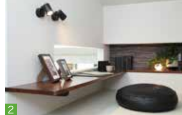
1 キッチン&ダイニング 2 寝室にあるロフトは2層構造になっていて、スキップフロアを利用しロフト型の書斎に。リビングを見渡せる窓が付いている (加古川店)