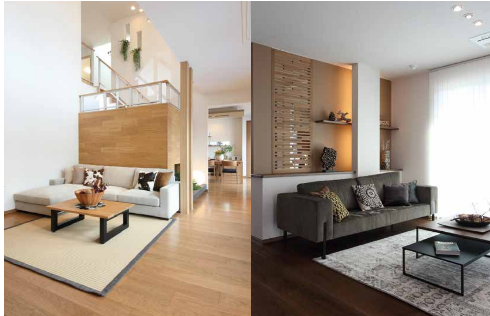
写真左:木の温もりを感じられるナチュラルでスタイリッシュなデザインのリビング。LDKとほどよく仕切られ、メリハリのある空間を演出。吹き抜けにすることで家全体に一体感が生まれている(加古川店)。写真右:カジュアルモダンテイストのリビングは家族のくつろぎの場に (西神店)