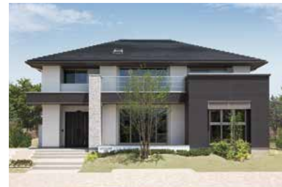
加古川店(上)の「Vシリーズ」と西神店(下)の「CXシリーズ」のモデルハウスは、上下階に4連ずつ配したファサードサッシと水平軒天が特徴。加古川店はスクラッチブリックタイルで上品なシルエットに、西神店はシックな雰囲気落ち着いた印象に

ホームづくりのイメージを膨らませてみましょう。 また、千葉県にあるハウジングパークのモデルハウスに宿泊できる「住まいの体験宿泊」を受け付け中。家族が長く暮らす大切な住まいだからこそ、住み心地を確かめたいもの。家事動線などの快適性や、キッチンや風呂など設備の利便性などを実感できると好評があります。家づくりを見て、触れて、体験できる仕掛けがいっぱいのクレバリーホームハウジングスクエアを併設しています。宿泊体験を予約すると、もちろん東京アイズニランドまたは東京ディズニーシーのチケットをプレゼント。予約や詳細はお近くのクレバリーホームへお問い合わせを。