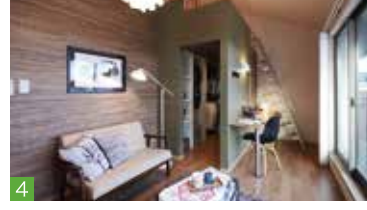
3 グリーンが癒やしと潤いを与える「UchiSoto court」を眺められるダイニング 4 「学び」「睡眠」「くつろぎ」の3つのエリアに分けた子ども部屋 (西神店)