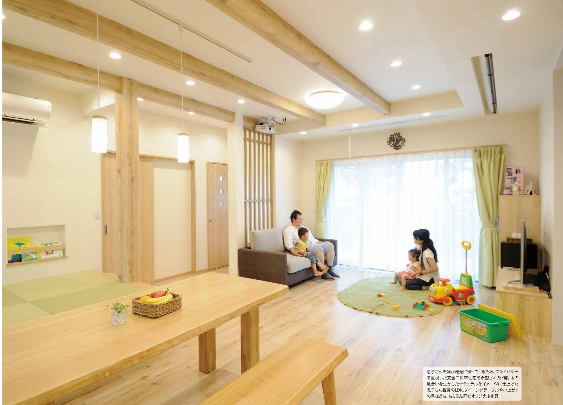
息子さん夫婦が地元に戻ってくるため、プライバシーを重視した完全二世帯住宅を希望されたK邸。木の風合いを生かしたナチュラルなイメージに仕上げた息子さん世帯のLDK。ダイニングテーブルや小上がりの畳なども、もちろん自社オリジナル家具