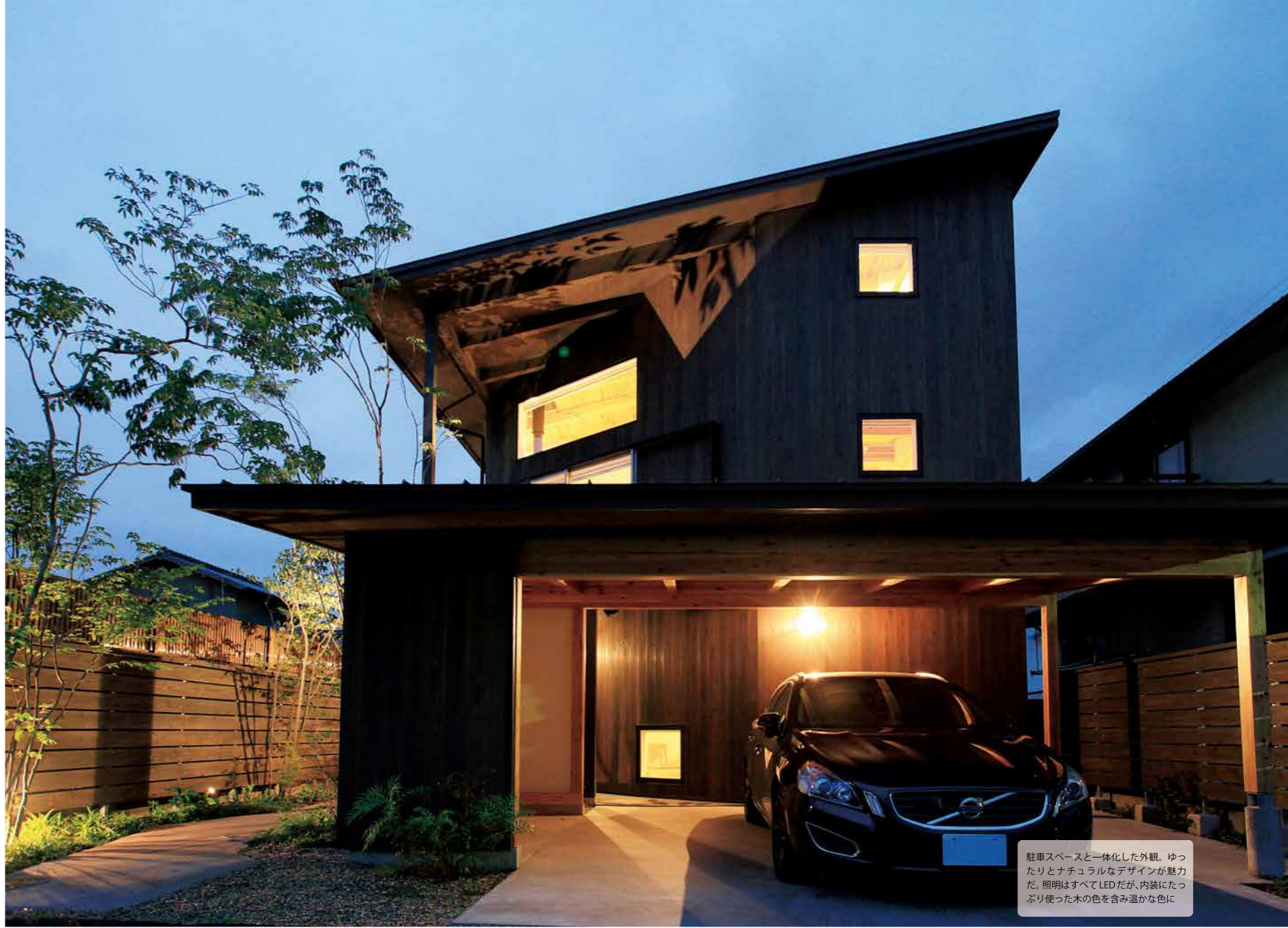
駐車スペースと一体化した外観。ゆったりとナチュラルなデザインが魅力だ。照明はすべてLEDだが、内装にたっぷり使った木の色を含み温かな色に

Check! 建物の東南の角をカットしたりピンク。サッシをフルオープンにすれば、三角形のデッキバルコニーがリビングと一続きに