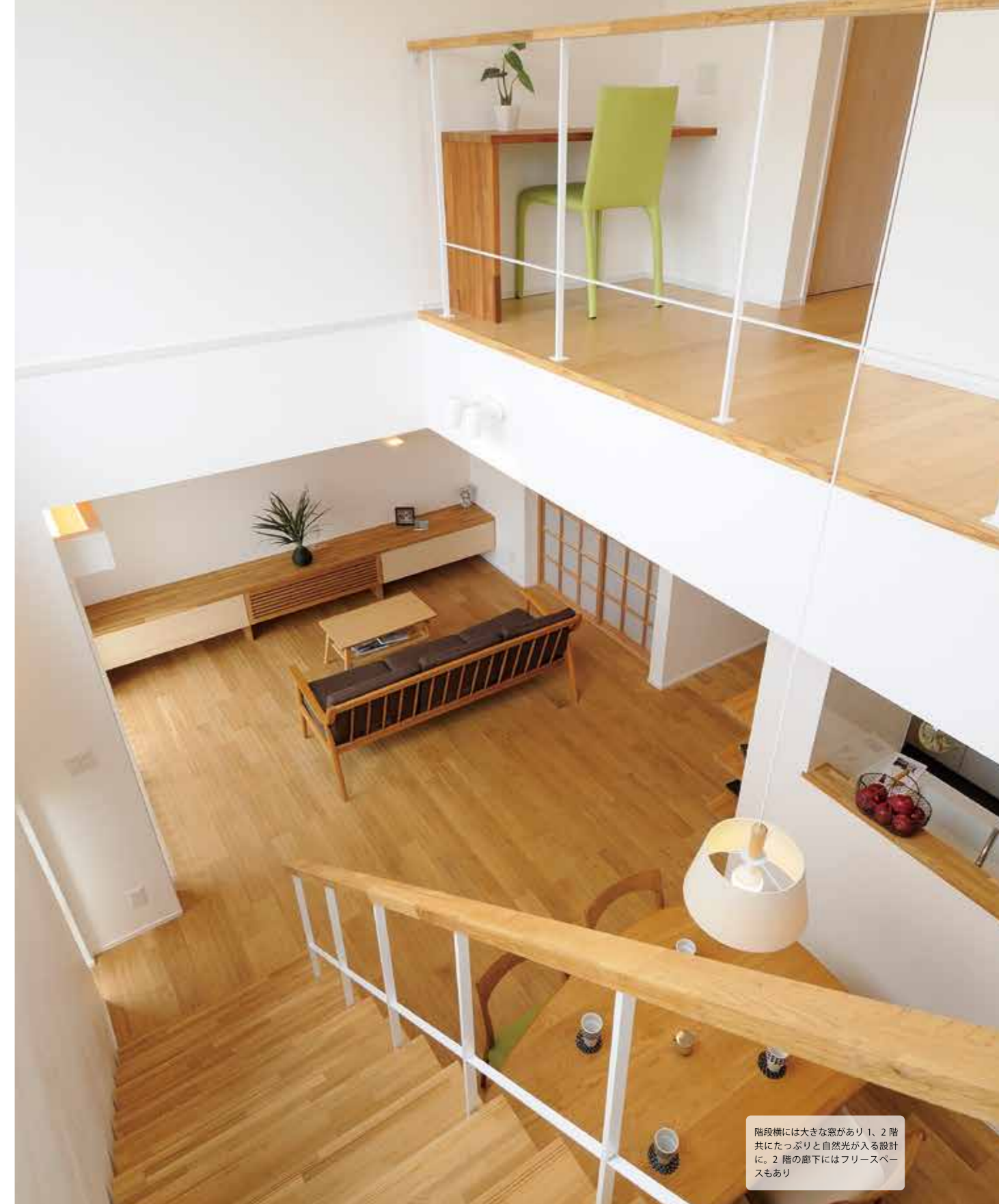
階段横には大きな窓があり1、2階共にたっぷりと自然光が入る設計に。2階の廊下にはフリースペースもあり

こちらのモデルハウスへは夏と冬の2回訪ねました。ポコポコしたスクラッチ加工を施してある無垢材を使用したフローリングは踏み心地がよく、夏ははだしで歩いてみてもさらっとした感覚が、冬には床をはだしで歩いたときのひんやり感はなく、室内履きは必要ないほどでした。その理由は気密性が高いからだとか。実際に訪ねてはだしで歩いてみてください。